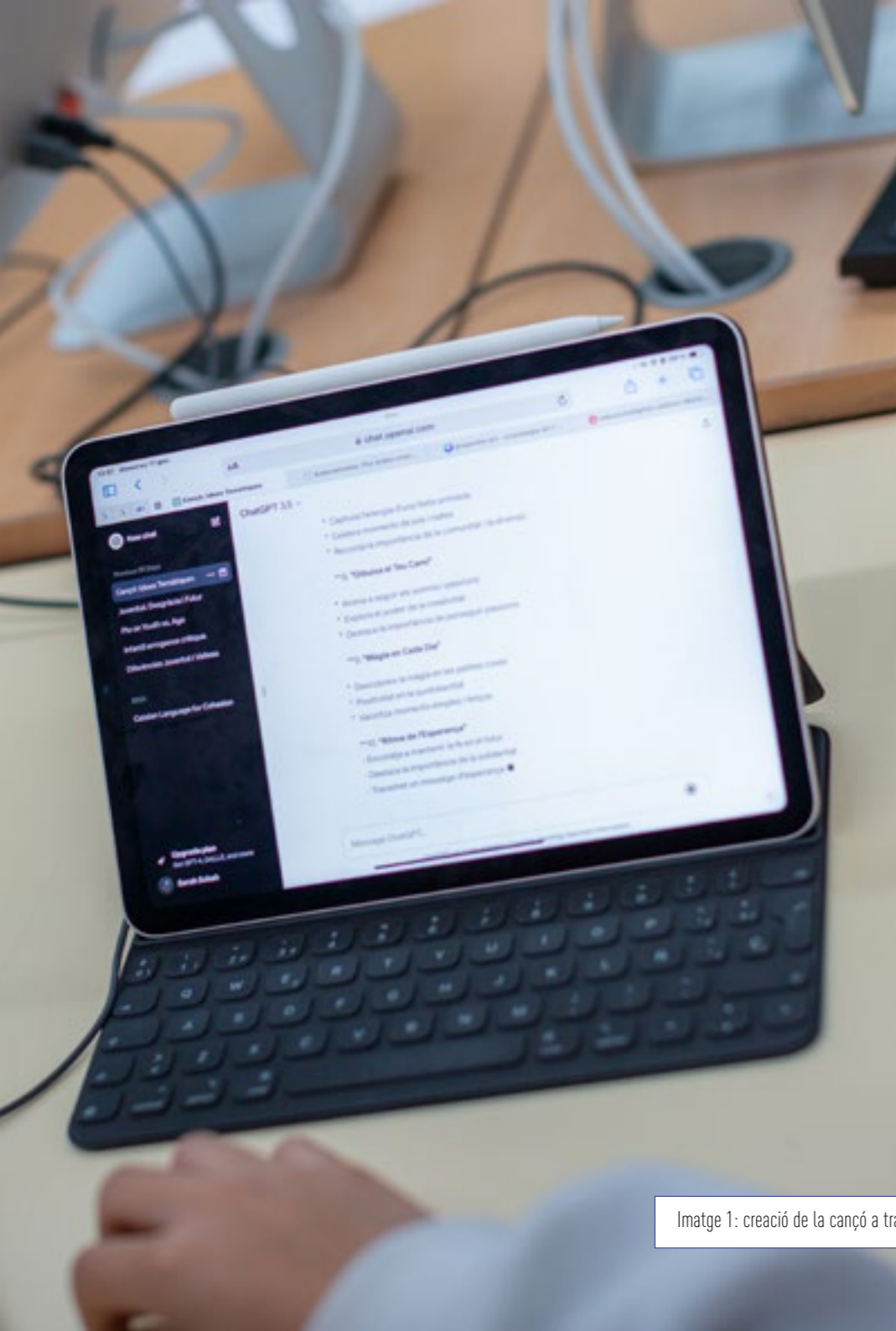
Imatge 1: creació de la cançó a través de chatgpt