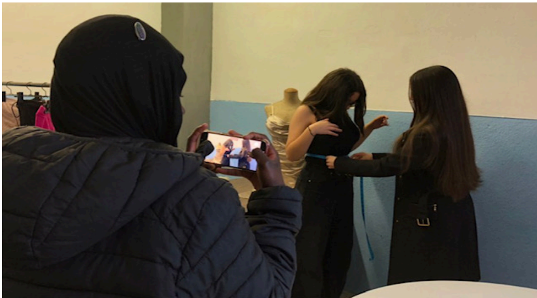
Imatge del rodatge

Més endavant s'estrenarà a Festimatge a la Matinal de Cinema i estarà obert al públic.