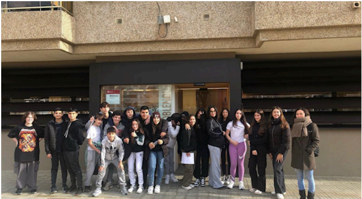
Visita a la Biblioteca de Poblenou

Amb la Biblioteca de Poblenou vam organitzar una sessió de recomanacions de llibres que tractessin el tema de les migracions i que ens poguessin servir com a font d'inspiració pel nostre curtmetratge.