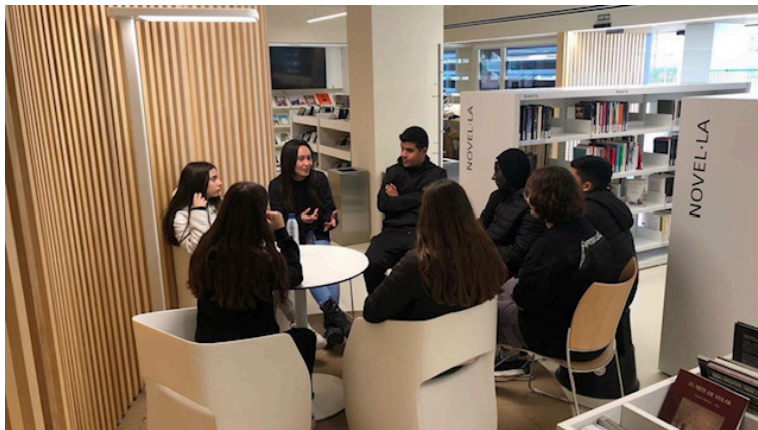
Imatges de la biblioteca humana

Activitat 3. Procés de creació d'un personatge. En grups de treball de 4 alumnes es van plantejar com crear personatges. En un minut havien de fer un audiovisual on es presenta un personatge que tingui 5 característiques molt clares i que es poguessin veure en una presentació d'un minut. En la proposat havien de pensar de 7 a 10 adjectius de caracteritzessin els personatges i que en la projecció a classe els companys l'haguessin de descobrir.