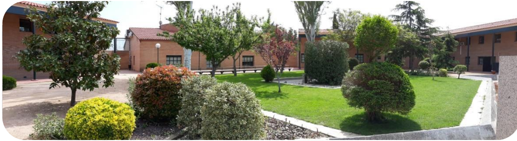
Jardí central del Centre Educatiu El Segre.

El claustre de les unitats docents del CE El Segre hem de dur a terme una activitat pedagògica que mostri una realitat sovint desconeguda a uns alumnes, que han viscut un context familiar, social i educatiu força complexe.