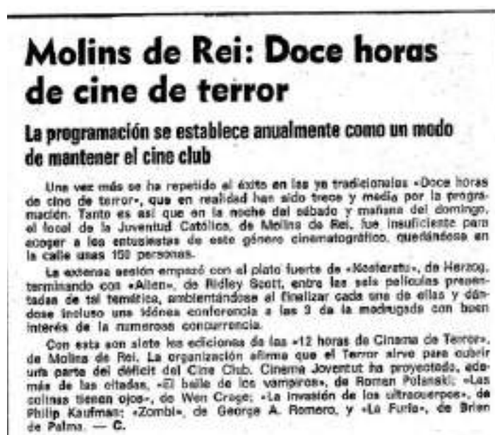
Figura 2. Article de La Vanguardia del 5 juliol del 1980, pàgina 57

Tot va començar als inicis dels 70 quan el cineclub local de Molins de Rei va prendre la iniciativa de crear la primera marató de cinema de terror de tota la Península. En un principi el festival es realitzava a l'estiu i constava de 16 hores seguides de cinema de terror sense cap pausa. En aquells primers anys, ja es van començar a projectar èxits com Psicosis (1960) d'Alfred Hitchcock i L'exorcista (1973) de William Friedkin. Només un any més tard de l'inici del festival a causa del seu èxit el Cine Club Molins de Rei i el Cine Joventut van decidir col·laborar-hi.