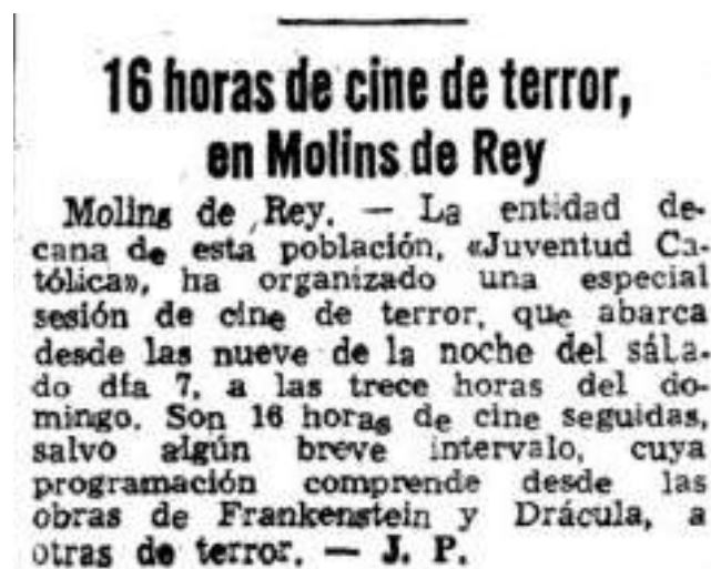
Figura 1. Article de La Vanguardia del 7 juliol del 1973, pàgina 47

El Festival de Cine de Terror de Molins de Rei és un festival mundial de cinema que està especialitzat en les produccions audiovisuals de terror i ficció. Va néixer l'any 1973 i des d'aquell moment es celebra anualment a la localitat de Molins de Rei. El seu nom, que en un inici era Setze hores de cine de terror , al 1978 va canviar a Dotze hores de Cine de Terror . En aquell mateix any aquest festival va passar a ser la primera marató especialitzada en cinema de Terror de tota la península Ibèrica.