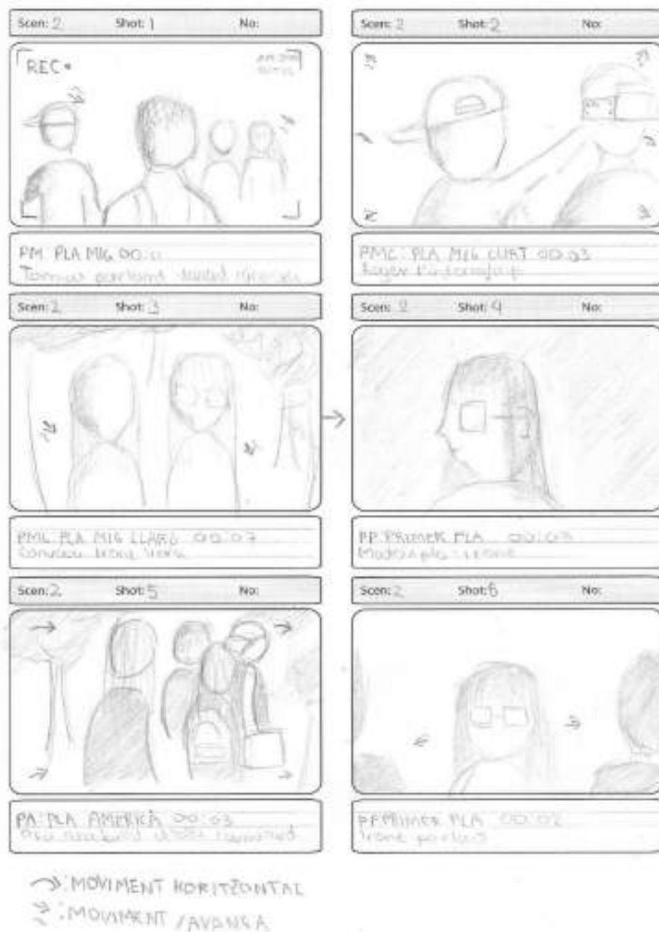
Figura 4. Fragment de l' storyboard. Escena 2

L'Storyboard és un guió il·lustrat on es representa la pel·lícula abans del rodatge. Es tracta d'una seqüència ordenada de les imatges de les diferents escenes amb l'objectiu de previsualitzar las ideas del guionista abans de gravar. És una eina que forma part de la preproducció. Acompanyant la vinyeta acostuma a haver la següent informació: número d'escena, número de pla, notes sobre l'àudio ( diàleg, música sons...) i també pot contenir breus informacions tècniques (com el tipus de pla).