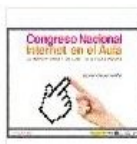
Metalingüística Congreso internet e...