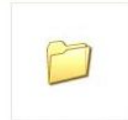
Narrativa Fem ràdio a l'institut