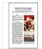
Metalingüística Congreso internet en el aula.pdf